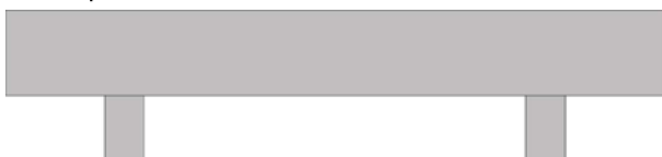
Конвектор Элегант мини